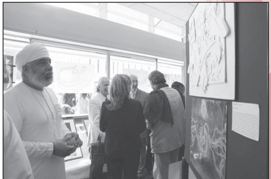
Mirando una exhibición con el tema de la paz.

Actuaciones musicales redondearon la final.