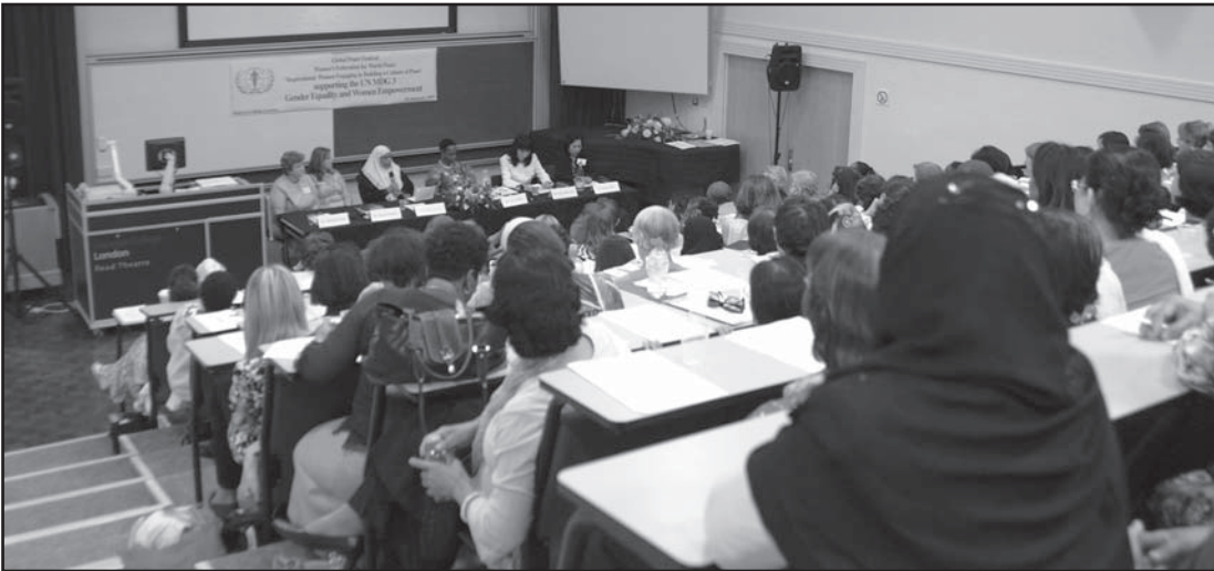
Le conferencia de mujeres.

valorarnos a nosotras mismas y a otras de igual manera, y de respetar las diferencias, puesto que las diferencias dan riqueza a la vida.