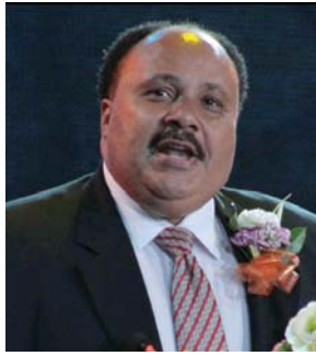
Martin Luther King III

realidad sus sueños y metas”, agregando que “aquellos que lideran con amor dejan un legado más perdurable.” El fundador y director de “Realizando el Sueño, Inc.”, citó las famosas palabras de su padre: “Cualquiera puede ser grande porque cualquiera puede servir. Sólo necesitas un corazón lleno de gracia y un alma generada por amor”.