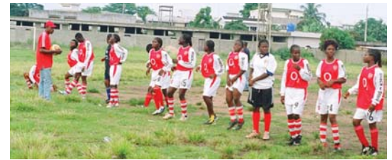
El equipo de chicas en el Festival por la Paz Global

Ceremonia de Reconocimiento en el Palacio del Congreso