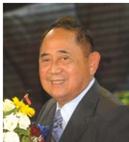
Jose de Venecia

E stamos aquí reunidos porque compartimos un mismo anhelo de paz universal. La paz en la tierra es nuestra mayor necesidad, pero es también nuestra meta colectiva más evasiva. Hay, tristemente, carencia de buena voluntad entre los hombres en el mundo actual.