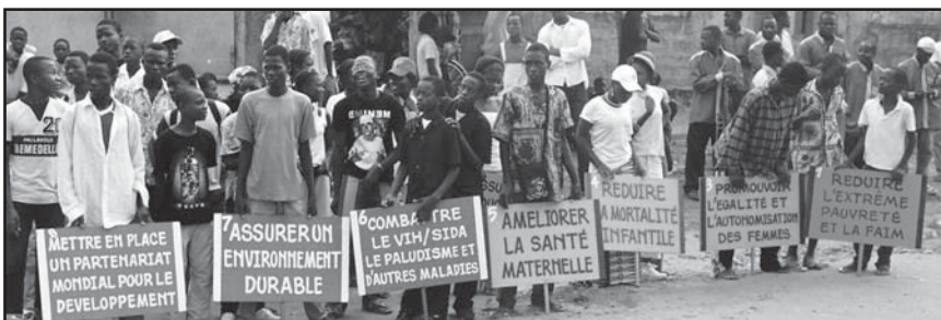
Participants en la Festival Global para la Paz en Benin, Africa, con posters explicando las Metas de Desarrollo del mileni

La tercera parte del proyecto eran reuniones entre las fuerzas gubernamentales en el sur y los rebeldes en el norte. Los oficiales estaban