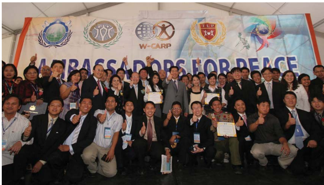
Jóvenes Embajadores por la Paz en las Filipinas jugaron un rol clave en el Festival por la Paz Global.