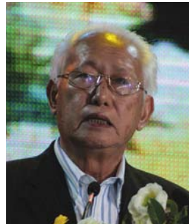
Hon. Alfredo Lim, Intendente de Manila

El programa principal comenzó con una "Oración por la Paz Universal" liderada por representantes de las religiones mundiales, quienes expresaron la convicción de que "Somos todos hermanos sin importar nuestro color de piel, nacionalidad o religión; somos una sola familia bajo Dios." Esto fue seguido por el Himno Nacional tocado por la Banda Filipina de las Fuerzas Armadas.