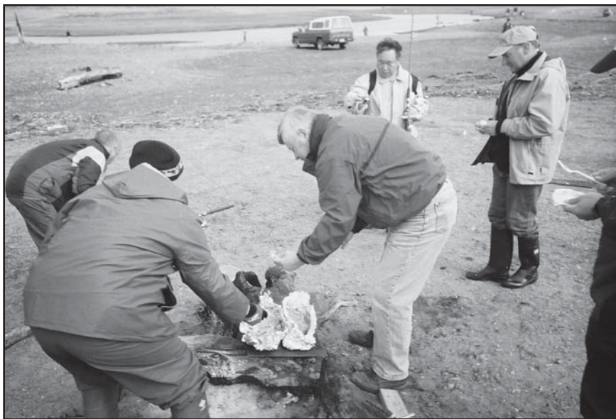
Algunas personas pescaron algunos salmones, uno de los cuales cocinamos recién sacado del río, y fue un delicioso almuerzo..

1ro. de septiembre: Éste fue el segundo día de pesca; esta vez tenía que ir de pesca en el río. Después del servicio matutino y del desayuno, mi grupo dejó el Jardín del Ángel en dos autobuses y disfrutó de un panorámico viaje de 40 minutos a través de caminos ondulados y maravillosas vistas de la isla de Kodiak hasta llegar al lugar de pesca. Pasamos unas cuatro horas en el primer lugar; algunas personas pescaron salmón, uno de los cuales cocinamos haciendo un delicioso almuerzo. El contexto montañoso y el paisaje eran impresionantes.