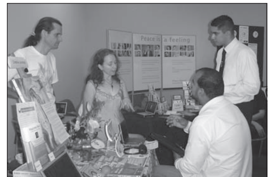
El eslogan "Clic" invitó a cada uno a mirar nuevas maneras de hacer "Clic" con una persona de diferente cultura.