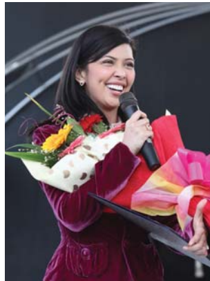
Srta. Pops Fernandez, la "Reina del Concierto" de las Filipinas.

Siguiendo al desfile, la concurrencia se congregó en la tribuna Quirino para el programa de entretenimientos que incluía las actuaciones de la Banda de las Filipinas de las Fuerzas Armadas y de la Universidad Politécnica de Banda Kawayan con instrumentos musicales nativos hechos de bambú. Las ganadoras de la "Competencia de Animadoras por la Paz" realizaron saltos acrobáticos y danzas de rutina bajo el lema de "Una sola familia bajo Dios", seguidos por actuaciones de cultura tradicional Filipina por el grupo de danza Rizalistas "Rigodon de Honor" y el famoso Grupo de Danza del Festival Ilo-ilo Dinagyang.